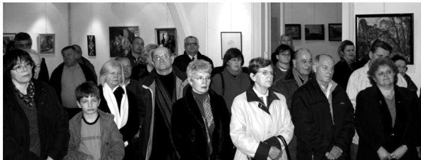
U danim uvjetima – jako dobar odaziv ljubitelja slikarstva

slikarstva, otkupljivao je reprezentativna djela predstavnika određenih likovnih smjerova, stvorivši tako vrijednu osobnu kolekciju. Iz nje je za ovu prigodu odabrao slike nastale krajem socijalističkog perioda, te ranih godina nakon osamostaljenja Ukrajine. To je ujedno i specifičnost ove izložbe, a za posjetitelje je bilo posebno vrijedno to što je prof. Vidmarović nakon otvorenja izložbe održao