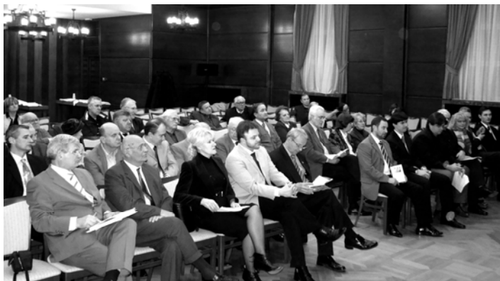
Uzvanici i članovi skupštine Hrvatsko-ukrajinskog društva

U ovoj godini Hrvatsko-ukrajinsko društvo planira pojačati aktivnosti na proširenju gospodarske, kulturne i druge suradnje Hrvatske i Ukrajine, potaknuti opsežniji rad postojećih i osnovati nove ogranke, sudjelovati u organiziranju prijateljskih sportskih susreta, nastaviti suradnju s Fondom Limić, organizirati kulturna zbivanja poput međunarodne likovne kolonije, rada ljetne škole Rusina i Ukrajinaca, boravak djece iz Ukrajine u Selcu i sl. Planira se i bolje informiranje otvaranjem Internet stranice, povećanje članstva itd.