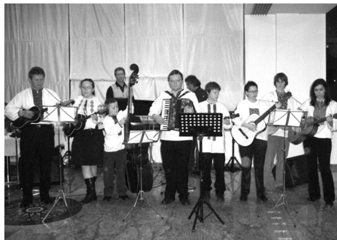
U KPD Rusina i Ukrajinaca Osijeka, nedavno osnovani orkestar „Zabranjeno pjevanje“ dobar je spoj starijih iskusnih glazbenika i mladih talenata.

Bal je otvoren tradicijskim nastupom zbora osječkog društva, koji je pod ravnanjem prof. Šimovića otpjevao rusinsku "Večar majovi" i ukrajinsku pjesmu "Jihav kozak na vijnonjku". Potom se, bogatim programom pjesama i plesova, predstavilo KUD "Jakim Govlja" iz Mikluševaca. Između dvije plesne točke, dok su plesači presvlačili nošnje, svojim prvim nastupom se predstavio u osječkom društvu tek osnovani orkestar "Zabranjeno pjevanje", koji je pjesmama "Ked bi čarni očka" i "Kolomyjka" oduševio nazočne.