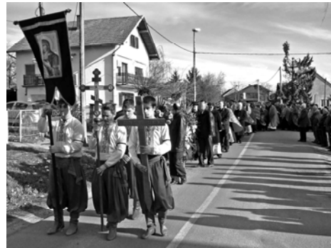
Хрест несли члени КМТ-ва «Карпати»

Давнє бажання о. Ярослава було, щоб на його похороні хор, згаданого КПТ-ва «Карпати», відспівав Шевченків «Заповіт». З глибокої жалоби, хор не міг співати і тому ці вірші прочитано. #