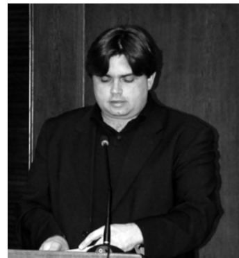
Nj.E. Markijan Lubkivskyj

nedavno tiskane knjige o Velikom gladomoru 1932/33. u Ukrajini. Veleposlanik Ukrajine u RH Markijan Lubkivskyj vrlo se pohvalno izrazio o suradnji s ovim društvom, a glede njenog nastavka iznio je i niz prijedloga poput: postavljanja spomenika Ivanu Franku u Lipiku; tiskanja ukrajinsko-hrvatskog rječnika; spomena poznatom ukrajinskom fizičaru, osnivaču hrvatskog Instituta za istraživanje građevinskih materijala, Stepanu Timošenku; organiziranja konferencije o hrvatskom slavisti Vatroslavu Jagiću, pod nazivom «Jagić i Ukrajina», te promidžbe priznanja Holodomora genocidom. Ovi i drugi prijedlozi bit će razmotreni na upravnom odboru. #