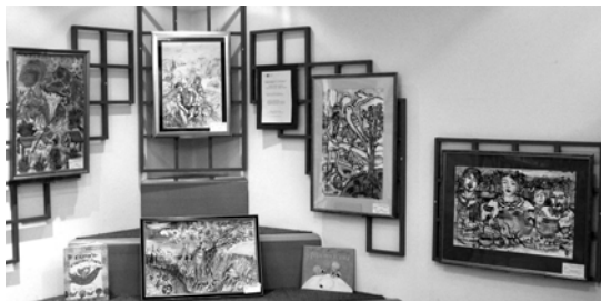
Dio izloženih radova djece iz Ukrajine

Zalaganjem Vladimira Pročija, predsjednika Društva Rusina i Ukrajinaca „Rušnjak“ Primorsko-goranske županije, u Hrvatsku je, pod nazivom „Srebrno zvonu“, stigla putujuća izložba nagrađenih likovnih radova djece i mladih iz Ukrajine. U suradnji spomenutog društva i Gradske knjižnice u Zagrebu, ovi likovni radovi su 18. ožujka o.g. izloženi na dječjem odjelu knjižnice, Starčevićev trg 4, a izložba će trajati do 04.04.2009. Primjereno mjestu izlaganja, inicijativom voditeljice Središnje knjižnice Rusina i Ukrajinaca Katarine Todorčev Hlača, iz fundusa te knjižnice uz slike su izložena i reprezentativna dječja knjižna izdanja iz Ukrajine. #