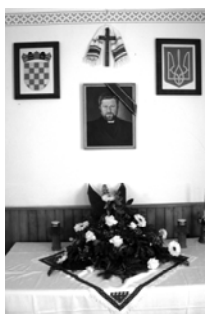
Траурний куток у спільному залі домівки