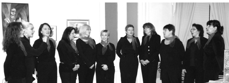
Vrstan nastup nedavno osnovane riječke ženske klape „Gondola“