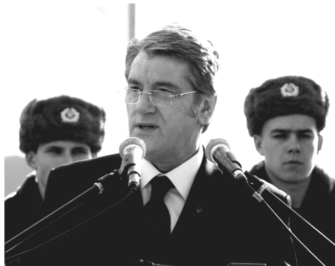
Президент Віктор Ющенко на «Червоному полі»

В суботу, 14 березня 2009 р., Президент України Віктор Ющенко разом з дружиною Катериною був на Закарпатті, де взяв участь у заходах з нагоди 70-ліття подій, пов'язаних з проголошенням Карпатської України. Після покладання квітів до меморіальної дошки президента Карпатської України Августина Волошина біля будинку, де він проживав, Ющенко з дружиною взяв участь у молебні в пам'ять героїв Карпатської України, який відбувся в греко-католицькому Свято-Вознесенському соборі міста Хуст за участю представників місцевої влади, духовництва і місцевої громади.