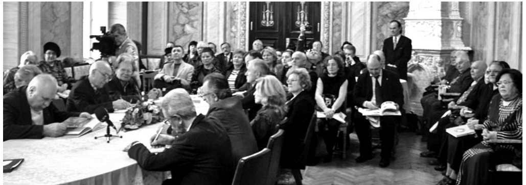
Присутні на презентації книги «Українського цвіту по всьому світу»

Підготовлено книгу до друку на основі матеріалів, наданих представленими в ній особами: їхніх спогадів про Батьківщину, розповідей про професійну та громадську діяльність, родини та особисте життя. Непересічність цього видання у тому, що це перше такого стибу вітчизняне видання: формат А4, Тверда обкладинка, крейдований папір, повнокольоровий друк.