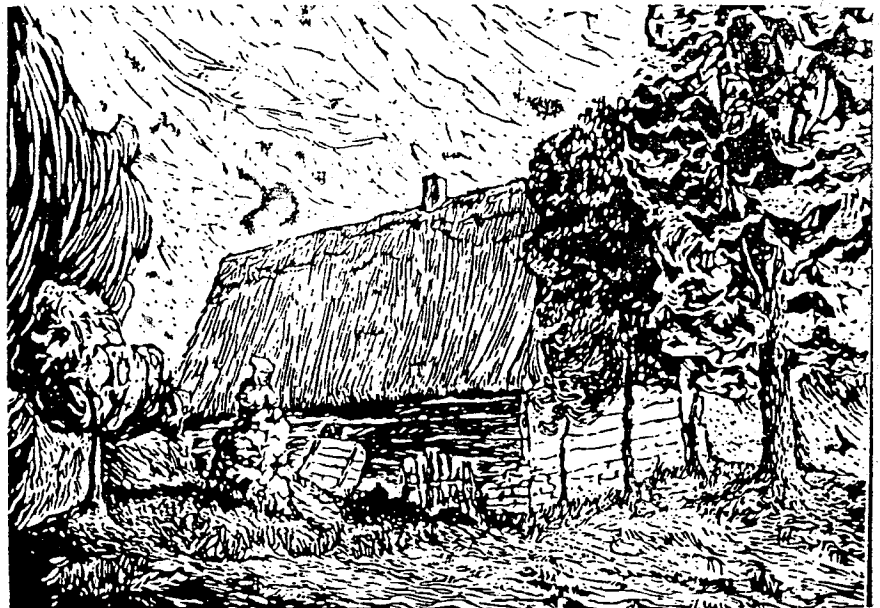
М.Костів - Чья то рідна хьжа? (Радощці)