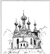
Церков Усп. П. Б. в Клинквіці збудувана (1914) о рік по смерти В. Щавинського, тепер не існуюча

Мал я ту можливість, гу великою моюю задоволенію, быти участником гардого обряду нашої православної церкви. Был ем на правду гордий з принадлежности до ней.